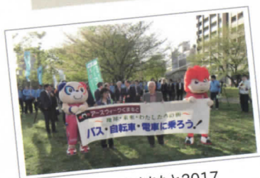
アースウィークくまもと2017 ノーマイカーパレード